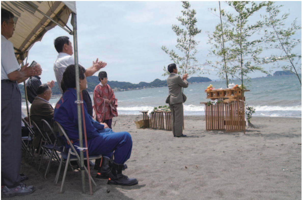
7 月 3 日 海の祈願祭