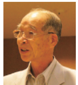
三国 幸次 議員

町長 住宅用太陽光発電設備補助金や住宅取得奨励金など、住環境に関する補助金については充実を図つてき