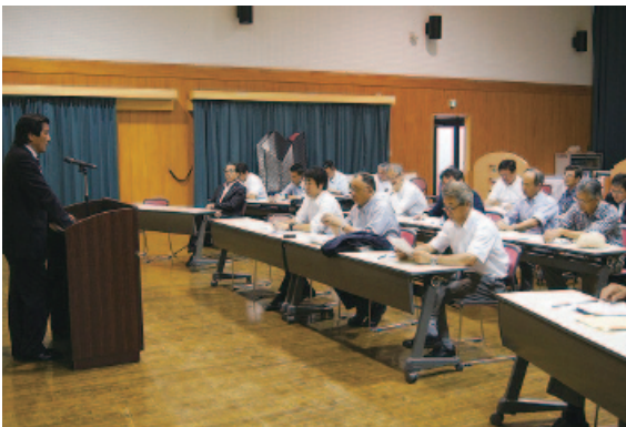
6月24日 小学校跡地等利用検討特別委員会先進地視察