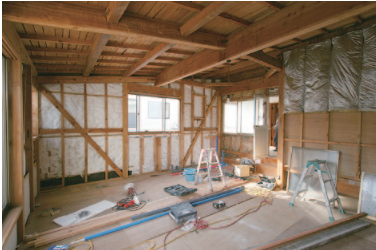
リフォーム中の建物

質問 住宅リフォーム助成制度は、工事を地元業者に発注するという条件の自治体が多い。そのため、他の市町村では不況により困つ