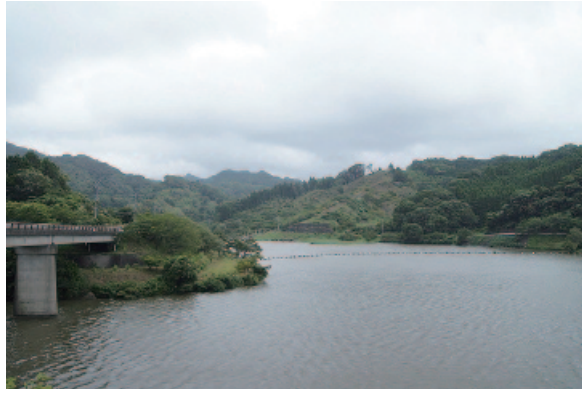
景観整備を予定している佐久間ダム