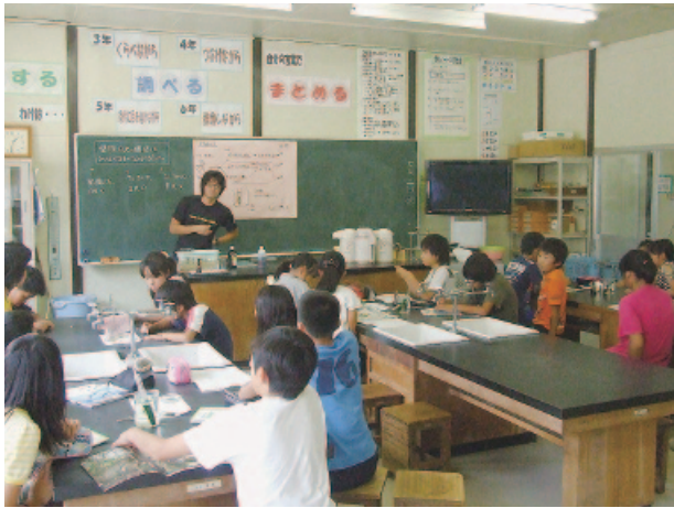
特別教室での授業風景

現在の削減額は約1千100万円だが、この改正により、さらに約1千100万円の職員給与のカットを行うこととなる。期間は本年7月から来年3月まで。