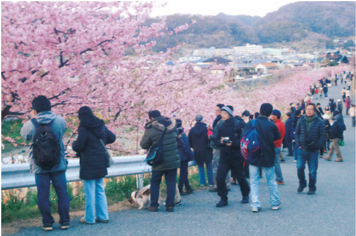
頼朝桜が満開の保田川周辺