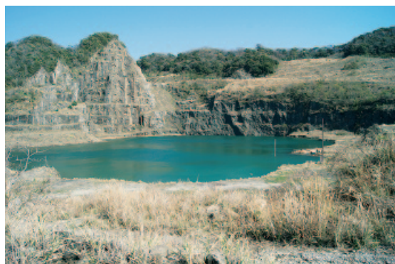
深掘りされた採石場

して意見書(案)が上程され、賛成多数で可決した。これにより、鋸南町議会には千葉県知事及び鋸南町長へ意見書の提出を行った。