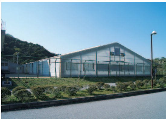
改修が決まった海洋センタープール棟