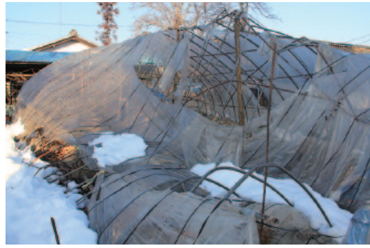
雪害を受けたビニールハウス