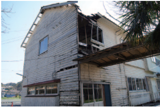
老朽化により解体される旧一中校舎