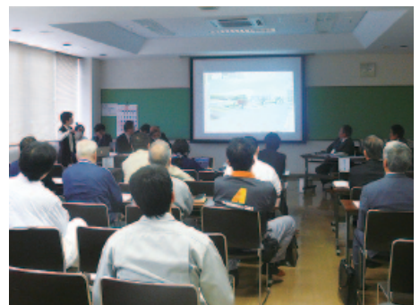
テナント募集説明会の様子

〜)の7442人とさらなる減少を予測している。「人口減は全てに悪影響を及ぼし、今までの政策では人口減に歯止めはかからなかった」と町長は答弁しているが、未だ人口減対策の政策が見えない。計画を時系列に町民に示されたい。 町長 交流人口の増加をもつて、定住化への転換をと