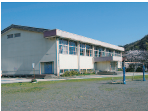
直売所へ改修される体育館

保健福祉課長 定期接種としての位置づけはそのままですが、国の通達に従い積極的な勧奨は控えています。