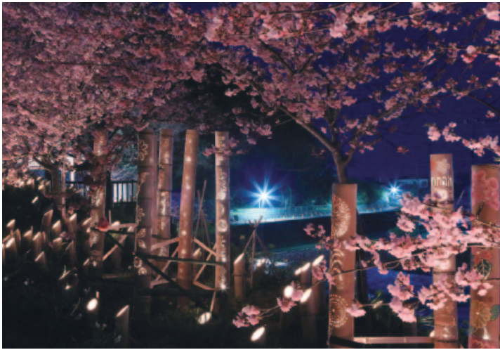
保田川頼朝桜の里竹灯籠まつり

立った案内表示の充実が必要不可欠だと考えていますが、今後も住民主体のイベントを皆で後押ししていきたいと思えます。