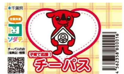
△新しいチーパスカード