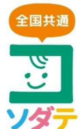
△全国共通ロゴマーク