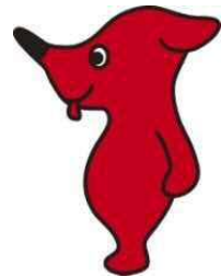
千葉県PRマスコットキャラクター チーバくん