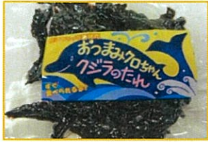
「おつまみクロちゃん」 1袋650円(税込み)