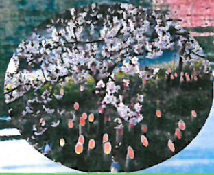
保田川・頼朝桜竹灯籠まつり