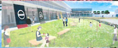
都市交流施設道の駅保田小学校 12月11日(金)オープン!