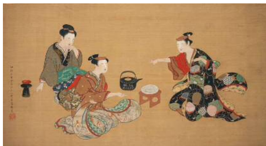
月岡 雪鼎「拳遊び図」